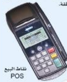
نقاط البيع POS

فخدمة الصراف الآلي AT M ، نقاط المبيعات POS ، واصدار جميع انواع البطاقات الالكترونية جميعها تساهم في تطوير مستوى البلد الحضاري ونقل اليمن نقلة نوعية وتطور بنوعها مما يجعلها في قائمة البنوك المتنافسة على مستوى المنطقة.