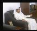
البنك التجاري اليمني يفتتح مقره بولاية الكويت

عقدت الأكاديمية العربية للعلوم المالية والمصرفية في مدينة عدن دورة بعنوان أساسيات العمليات المصرفية ، شارك فيها ٢٨ مشاركاً من مختلف البنوك اليمنية وقد شارك فيها عدداً من موظفي البنك التجاري اليمني بلغ عددهم ٨ مشاركون ولقي هذه المشاركة ضمن اهتمام إدارة الموارد البشرية بالتدريب اللازم لموظفيه والذي يأتي ضمن إطار برنامج وخطط إدارة الموارد البشرية في تأهيل وتدريب موظفي البنك بشكل مستمر يتواءم مع التطورات المصرفية لتقديم الخدمات المصرفية بأفضل الأساليب والوسائل . وقد حضر في هذه الدورة الدكتور / خليل الشباع نائب رئيس الأكاديمية العربية للعلوم المالية والمصرفية حيث عبر عن إعجابيه الشديد بموظفي البنك من حيث التواجد والمشاركة الفعالة . وتعتبر هذه الدورة سلسلة من الدورات التي تعقدتها الأكاديمية العربية للعلوم المالية والمصرفية .